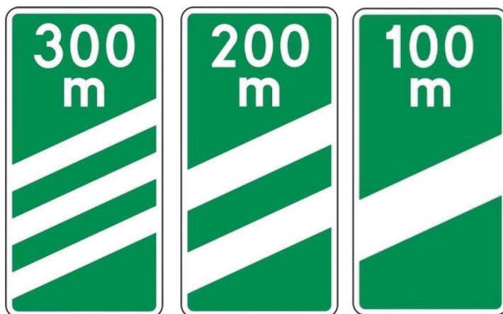
Ryc. 2. Tablice wskaźnikowe: F-14d, F-14e, F-14f umieszczane na drodze ekspresowej.